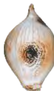
Mancha Negra (Carvão): Área enegrecida em virtude do ataque de fungos nos catáfilos externos.