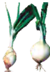
Talo Grosso: Quando a união dos catáfilos do colo do bulbo apresentam uma abertura maior que a normal, devido a um alongamento do talo pelo interior do mesmo.