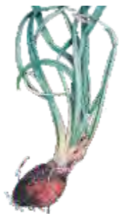
Brotado: Quando apresenta emissão de broto visível acima do colo do bulbo.