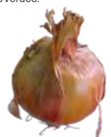
Falta de Turgescência (Flacidez): Ausência de rigidez normal do bulbo.