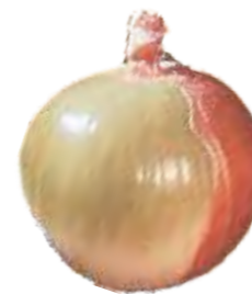
Falta de Catáfilos (películas): É o bulbo que apresenta mais de 30% de sua superfície desprovida de catáfilos envoltentes.