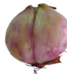
Deformado: O que apresenta formato diferente do típico do cultivar, incluindo crescimentos secundários, ou seja, bulbos unidos pelo talo, apresentando externamente catáfilos envoltentes.