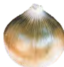
Descoloração: Desvio parcial ou total na cor característica do cultivar, incluindo o esverdeamento, ou seja, bulbo com catáfilos externos verdes.