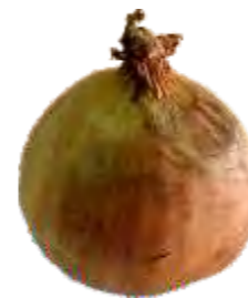
Dano Mecânico: Lesão de origem mecânica observada nos catáfilos do bulbo.