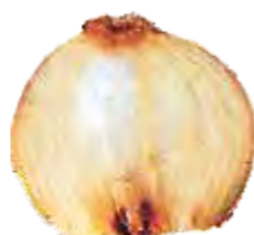
Podridão: Dano patológico que implique em qualquer grau de decomposição, desintegração ou fermentação dos tecidos.