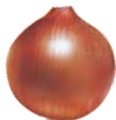
Vermelha, Pinhão ou Baia