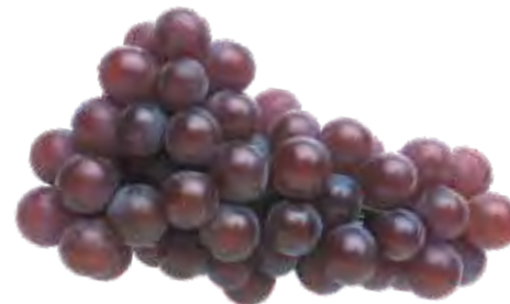
Ausência de Pruína