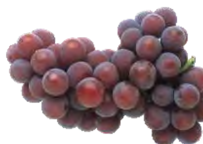
Cachos Mal Formados