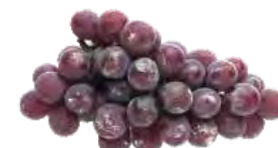
Presença de Substâncias (Resíduos) Estranhas ao Produto