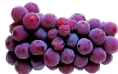
Falta de Limpeza

Uva Imatura: teor de sólidos solúveis < 14º brix