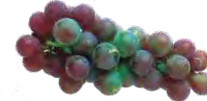
Ausência de Coloração Típica da Variedade