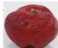
Dano por pragas