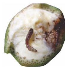
Dano por praga