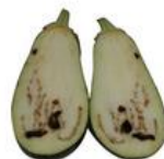
Dano por praga