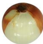
Perda de catáfilo interno