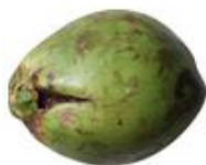
Dano por praga