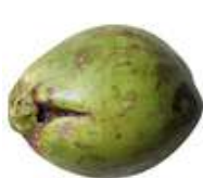
Dano por praga