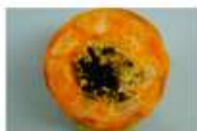
Defeito de polpa