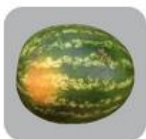
Queimado de sol grave