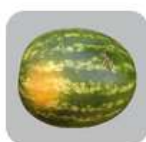
Queimado de sol grave