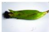
Dano por praga