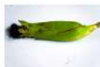
Dano por praga