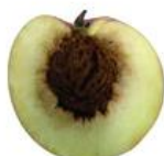
Defeito de polpa