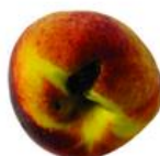
Dano por praga