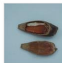
Dano por praga