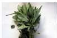
Dano por praga