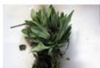
Dano por praga